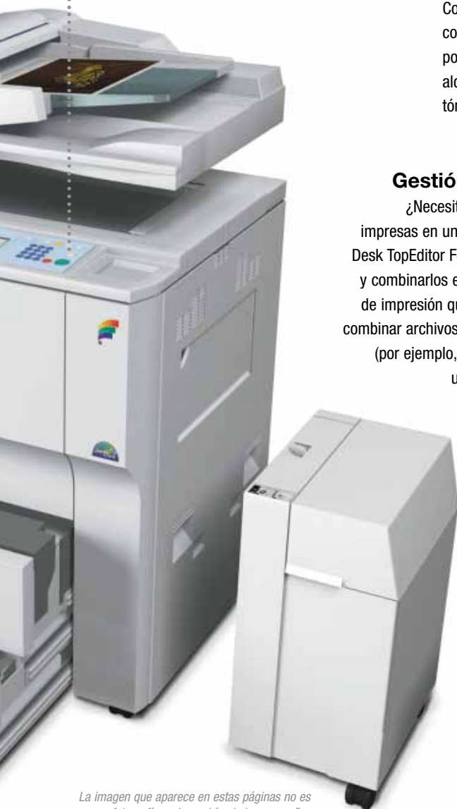
La imagen que aparece en estas páginas no es una fotografía real y podrían haber pequeñas diferencias en algunos detalles.